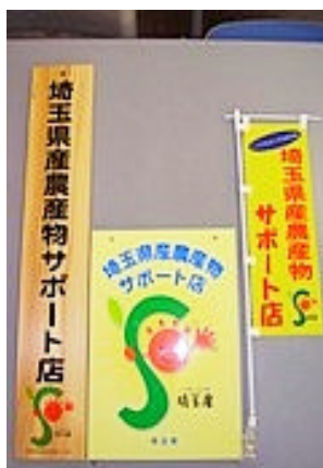
登録店に提供される看板(いずれか一つ)