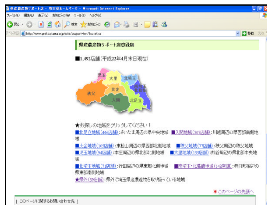
県ホームページでの紹介