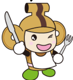
本庄ぐるぐるスコット はにぼん

当イベントを理解していただくための説明会を開催します！イベントの詳細について、ご案内いたしますので、参加をご検討の飲食店様におかれましては、ご出席くださいますようお願い申し上げます。