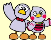
埼玉県のマスコット 「コバトン」「さいたまっち」

※ 交付決定後に対象となる取組を実施し、就業規則の作成又は改正を行う場合が対象となります。