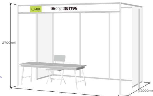
1小間分の展示ブースイメージ