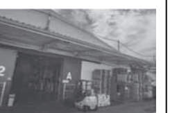
通販物流コンサルジュ宣言

経営革新テーマ 「ネット通販向け新役務の開発 (受発注システム開発、コール センター業務、ホームページ作成 支援など)」