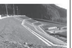
設計監理に携わった 高台造成団地