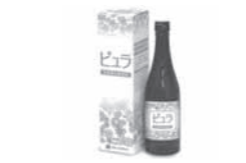
ドリンクタイプの自社製品

経営革新テーマ 「『乳酸菌生産物質』普及と健康増進を 目的とした他社との連携による 新製品開発および販路拡大」