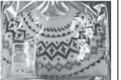
シルクパックサービス

経営革新テーマ 「シルクパック・リサイクルとブーツ クリーニングサービスによる新規 クリーニング需要の開拓と商圏の拡大」