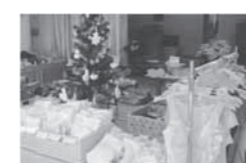
医療機関での展示即売会