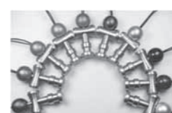
ねじ屋さんのものづくり シリーズ

経営革新テーマ 「オリジナル製品の製造を通じて 構築する、技術力のマニュアル化と 新たな販売体制づくり」