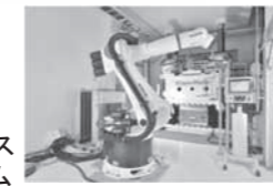
社内一貫生産体制を構築

経営革新テーマ 「複合材成形加工技術の最適化プロセス 実現と高精度ハイブリッド生産システム の向上とサービスの提供」