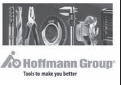
国内唯一の代理店

経営革新テーマ 「ドイツ工具販売グループ『ホフマン』の 正規代理店となり、ホフマンブランド 工具の取扱店として自社のブランドカ の向上を目指す」