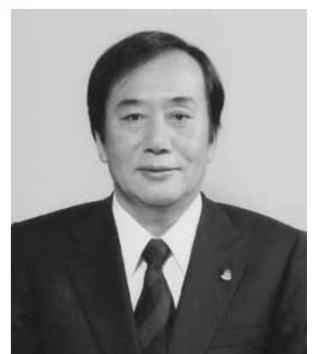
埼玉県知事 上田清司

企業がより一層の発展を遂げるためには、自社の経営状況をチェックし、課題を明らかにすることが重要です。そして、そのための絶好の機会となるのが「経営革新計画」の策定です。県では、計画の策定から、実行段階でのフォローアップまで、商工会議所、商工会と連携して全力で応援してまいります。皆様も、是非とも「経営革新企業」の仲間入りをしていただき、環境変化に負けない元気な埼玉企業となってください。心から御期待申し上げます。